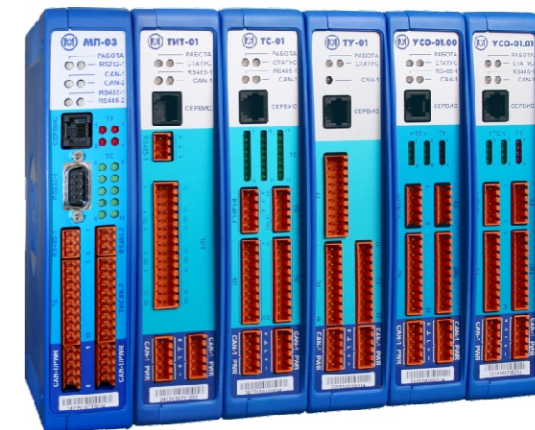
Контроллер МИР КТ-51