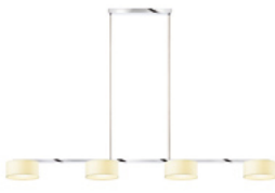
CANTARA / DOWN 4 BAR S zur Produktseite