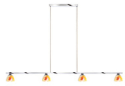
SILVA / DOWN 4 BAR S zur Produktseite