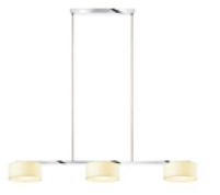
CANTARA / DOWN 3 BAR S zur Produktseite

Die CANTARA DOWN 3 bzw. 4 BAR S ist in der Stoff-Variante erhältlich. Die drei bzw. vier Leuchenschirme bestehen aus widerstandsfähigem Chintzstoff in einem edlen Creme-Ton. Der warme Ton des Stoffschirms erzeugt ein gemütliches und einladendes Wohlfühl-Ambiente am Esstisch. Auf diese Weise entsteht eine heimelige Lichtinsel, die zum Verweilen einlädt. Das Gehäuse der Pendelleuchte ist aus Aluminium gefertigt und in den Farben Chrom und Mattchrom erhältlich. Das transparente Kabel zur Stromversorgung dient gleichzeitig als Abhängung der Leuchte. So wird kein zusätzliches Stromkabel außerhalb der Abhängung benötigt und die Symmetrie des Designs gewährleistet. Das Leuchtmittel ist von einem Reflektor aus mundgeblasenem, opalem Kristallglas ummantelt, der das Licht gleichmäßig und weich auf dem Tisch verteilt. Die CANTARA DOWN BAR S mit drei Schirmen ist für eine Tischlänge von 1,6 m bis 2,4 m empfehlenswert. Mit vier Schirmen lässt sich eine Länge ab 2,4 m gut ausleuchten. Die energiesparenden 230V Eco-Halogenlampen sorgen durch ihr warmweißes Licht für eine gesellige Stimmung im Esszimmer.