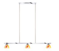
SILVA / DOWN 3 BAR S zur Produktseite

Die SILVA DOWN 3 bzw. 4 BAR S ist in dem harmonischen Ton orange-gelb erhältlich. Das äußere Glas ist ein mundgeblasenes Kristallglas, das bis zu 35 Mal in einem aufwendigen Produktionsvorgang dichroitisch beschichtet wird. Der innere opale Glasdiffusor lenkt direktes Licht auf den Esstisch und streut dabei einen kleinen Lichtanteil sanft durch das dichroitische Glas. So erscheint das äußere Kristallglas in faszinierend schimmernden Farben und sorgt für stilvolle Lichteffekte auf dem Tisch. Das Gehäuse der graziösen Pendelleuchte ist aus Aluminium gefertigt und in den Farben Chrom und Mattchrom erhältlich. Das durchsichtige elektrische Kabel der SILVA DOWN BAR S wird gleichzeitig als Abhängung der Leuchte verwendet. So stört kein zusätzliches Stromkabel das harmonische Erscheinungsbild der Leuchte. Mit drei Schirmen eignet sich die Pendelleuchte für eine Tischlänge von 1,6 m bis 2,4 m. Mit vier Schirmen lässt sich eine Länge ab 2,4 m gut ausleuchten. Die energiesparenden 230V Eco-Halogenlampen spenden warm-weißes Licht für ein gemütliches Verweilen im Familien- oder Freundeskreis.