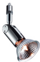
STAR / CLAREO SPOT PNT