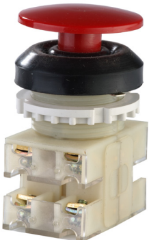
2з+2р, IP54, гриб, красный.