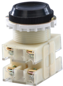
2з+2р, IP40 черный