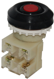
1з+1р, IP54 красный