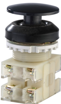
2з+2р, IP54, гриб, черный