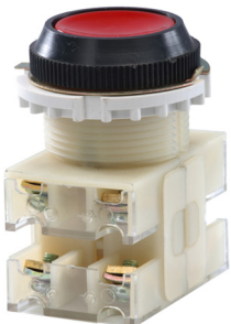
2з+2р, IP40 красный