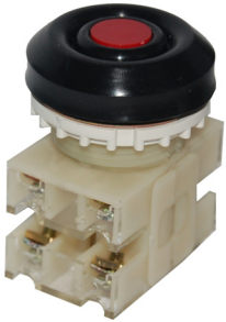
2з+2р, IP54 красный

ТУ 3428-005-59826184-2006 ГОСТ Р 500.30.5.1-99 Товар сертифицирован Гарантийный срок - 2 года со дня введения в эксплуатацию.