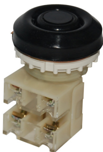
1з+1р, IP54 черный