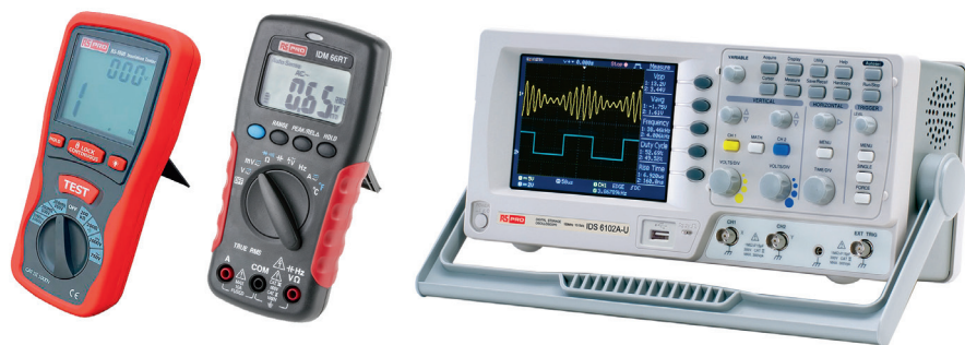
Рис. 4. Линейка контрольно-измерительных приборов

В современной промышленности измерение — одно из самых востребованных направлений, для этой задачи выпускается множество приборов, будь то различные датчики и сенсоры или мультиметры, осциллографы и т.д. Перечень оборудования настолько велик, что, казалось бы, трудно даже вообразить компанию, способную объединить в ассортименте все варианты. Однако RS Pro и в этом сегменте может предложить намного больше, чем остальные: различные виды осциллографов, анализаторов спектра, мультиметров, измерителей влажности и анемометров, а также любое другое измерительное