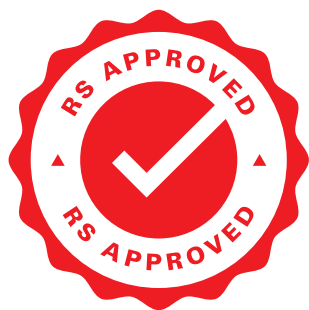
Рис. 1. Знак качества RS

сортименте и решениях RS Pro для производственных нужд.