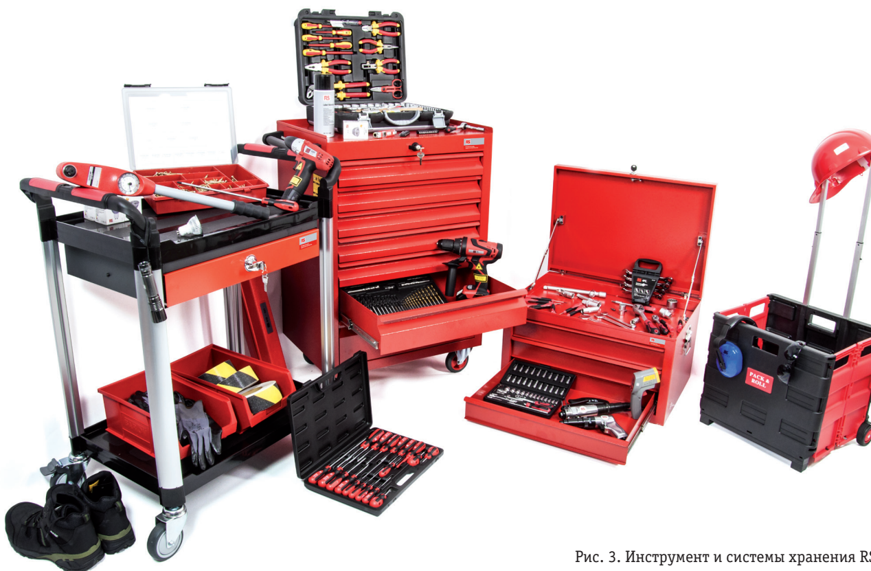
Рис. 3. Инструмент и системы хранения RS Pro

Имея такой широкий ассортимент, компания не могла не задуматься об организации систем хранения, иными словами – о различных устройствах и емкостях для переноски и хранения инструмента. Они могут быть как мелкого формата (к таким, например, относятся чемоданы со специальными отделен-