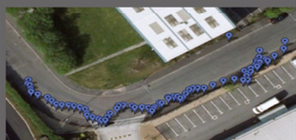
Обработка данных Google Earth™