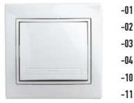
1-102 Выключатель с подсветкой, 10А-250В, СУ