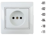
1-201 Розетка 2P, 16А-250В, СУ