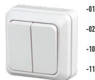
2-104 Выключатель двойной, 10А-250В, ОУ