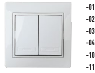
1-104 Выключатель двойной, 10А-250В, СУ