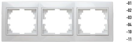
1-503 Рамка на 3 поста гор., СУ