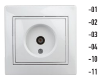
1-301 Розетка TV одиночная, СУ