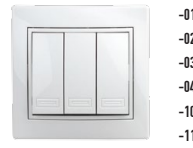
1-106 Выключатель тройной, 10А-250В, СУ