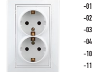
1-205 Розетка 2X2P+E Schuko, 16А-250В, СУ