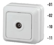
2-301 Розетка TV одиночная, ОУ