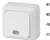
2-102 Выключатель с подсветкой, 10А-250В, ОУ