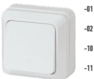
2-101 Выключатель, 10А-250В, ОУ