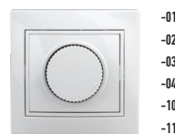
1-401 Светорегулятор поворотный, 600Вт 230В, СУ