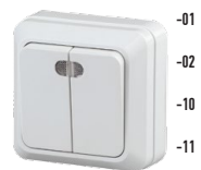
2-105 Выключатель двойной с подсветкой, 10А-250В, ОУ