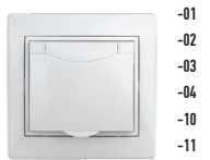
1-203 Розетка 2P+E Schuko с крышкой, 16А-250В, СУ