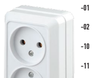
2-203 Розетка 2x2P, 16А-250В, ОУ