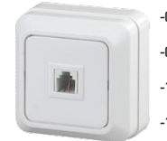
2-302 Розетка телефонная RJ11, ОУ