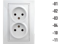
1-204 Розетка 2x2P, 16А-250В, СУ