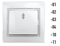
1-103 Переключатель, 10А-250В, СУ