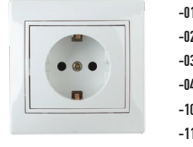
1-206 Розетка 2P+E Schuko со шторками, 16А-250В, СУ