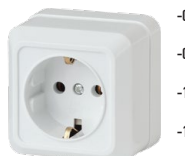
2-202 Розетка 2P+E Schuko, 16А-250В, ОУ