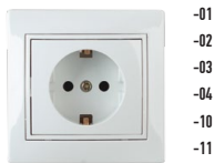
1-202 Розетка 2P+E Schuko, 16А-250В, СУ