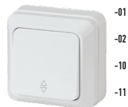
2-103 Переключатель, 10А-250В, ОУ