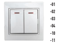
1-105 Выключатель двойной с подсветкой, 10А-250В, СУ