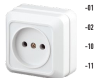
2-201 Розетка 2P, 16А-250В, ОУ