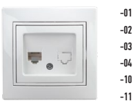
1-302 Розетка телефонная RJ11, СУ