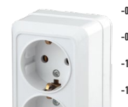
2-204 Розетка 2x2P+E Schuko, 16А-250В, ОУ