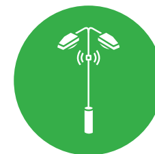
WiFi и Small Cell транспорт