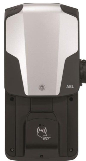
eMH1 с RFID-идентификацией