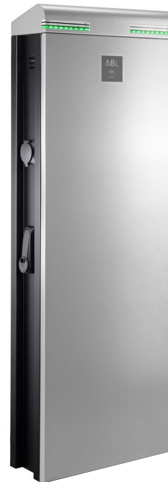
Charging pole eMC3