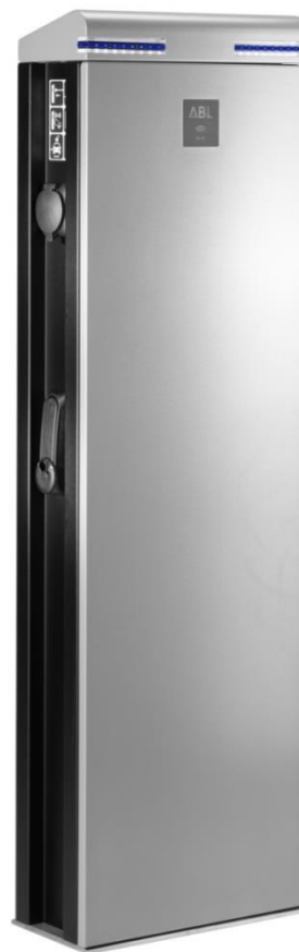
Charging pole eMC2