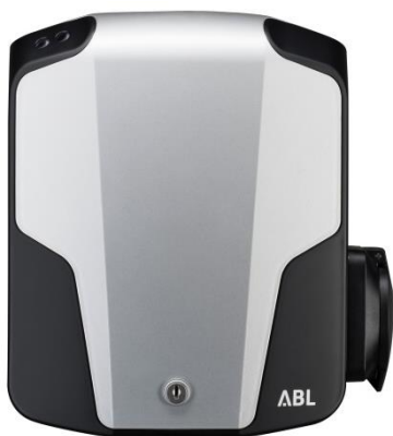
eMH1 с зарядной розеткой