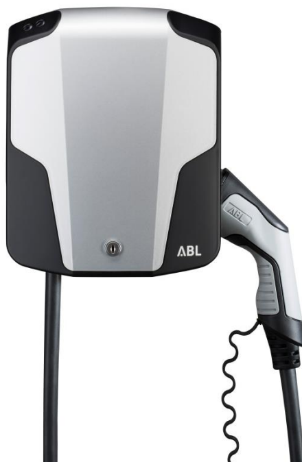
eMH1 с зарядным кабелем